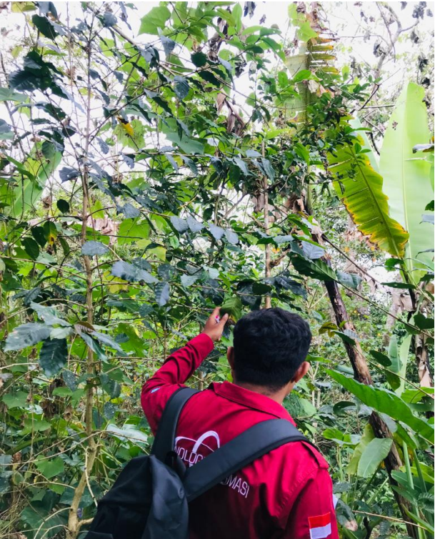
Pengamatan dan wawancara para petani di perkebunan kopi lakmaras