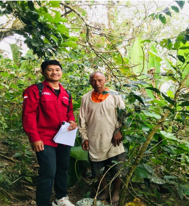
Pengambilan data dan foto bersama petani kopi lakmaras