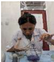
Hasil uji antibiotik terhadap bakteri patogen Bakteri E. coli dan S. aureus