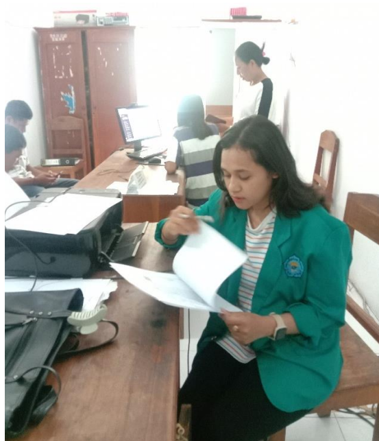
Dokumentasi Penelitian Pembuatan Kartu AK-1/Kartu Kuning