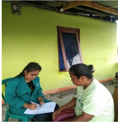
Gambar IV Wawancara dengan Masyarakat