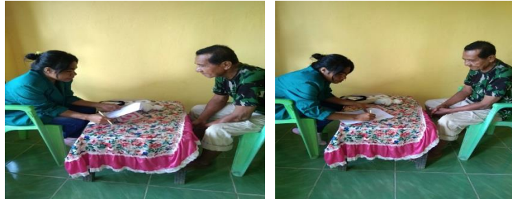
Gambar I Wawancara dengan Kepala Desa Oan Mane