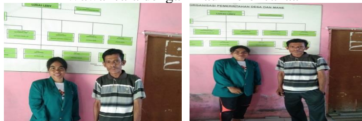
Gambar II Wawancara dengan Kaur Perencanaan