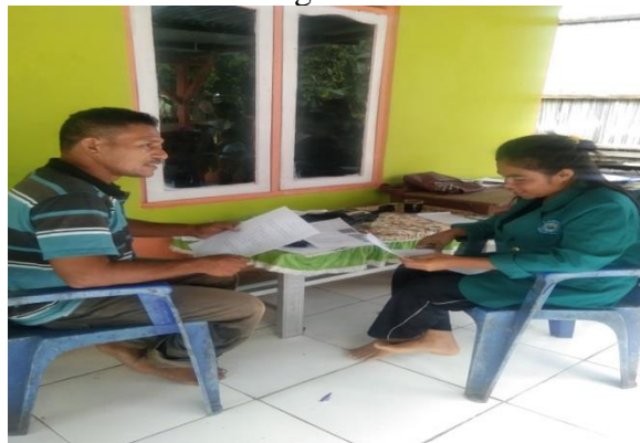
Gambar III Wawancara dengan Kaur Umum/TU