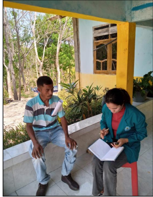
Hasil wawancara bersama masyarakat desa Oenenu Utara.