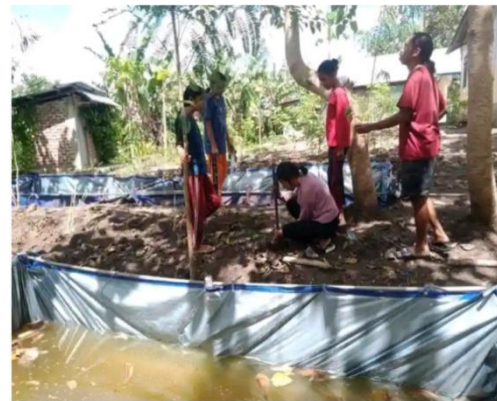
Hasil partisipasi karang taruna dalam pembangunan membuat kolam ikan di kantor desa