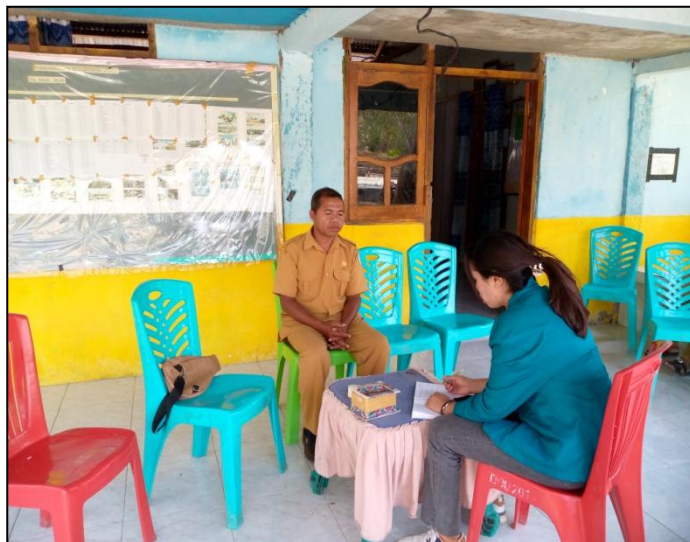
Hasil wawancara bersama kepala Desa, Bpd dan sekretaris desa Oenenu Utara