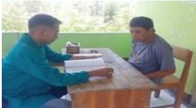
Wawancara bersama Bapak Sekertaris BUMDes Desa Tapenpah