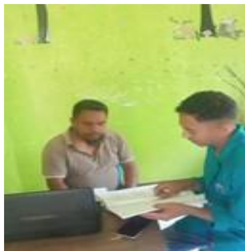
Wawancara bersama Bapak Ketua BUMDes Desa Tapenpah