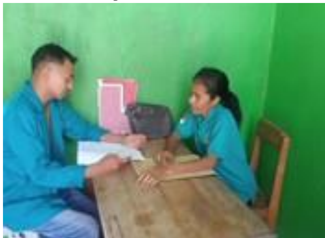
Wawancara bersama Ibu KAUR Perencanaan Desa Tapenpah