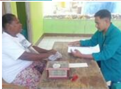
Wawancara bersama masyarakat Desa Tapenpah