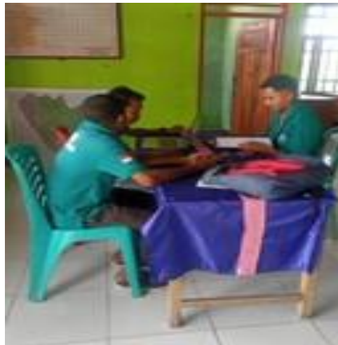
Wawancara bersama Bapak Sekertaris Desa Tapenpah