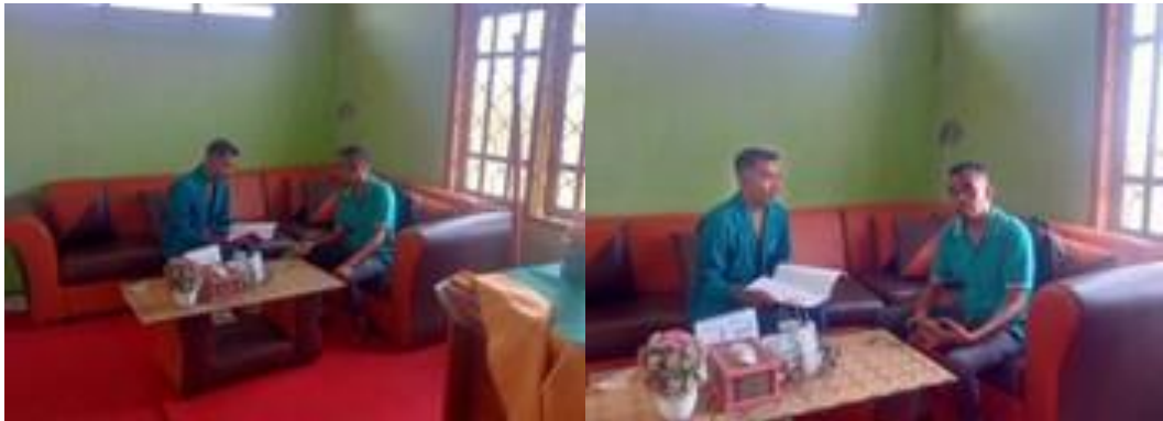
Wawancara bersama Bapak Kepala Desa Tapenpah