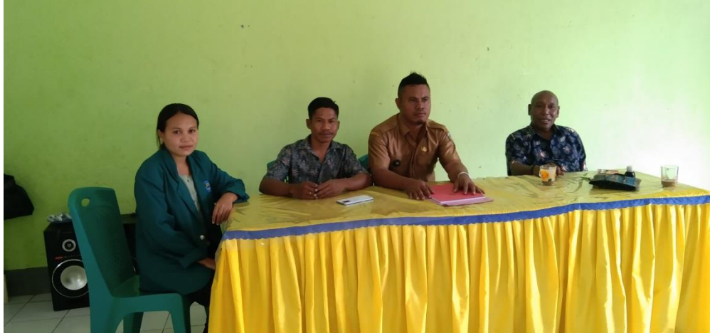
Hasil Dokumentasi Kepala Desa Dan Aparat Desa Umalawain