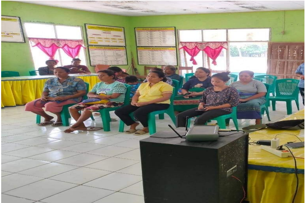
Hasil Dokumentasi Penyuluhan Tentang Program KB Desa Umalawain