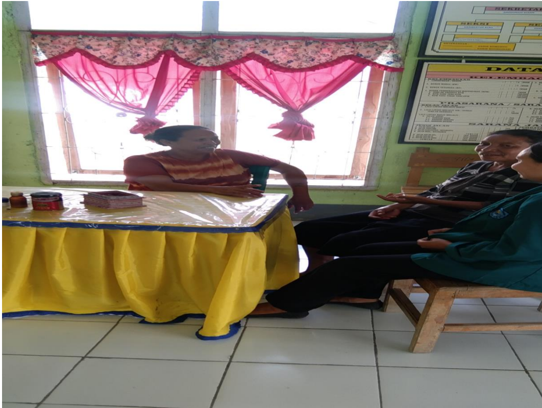
Hasil Dokumentasi Bersama Bidan Desa Dan PPKB Desa Umalawain