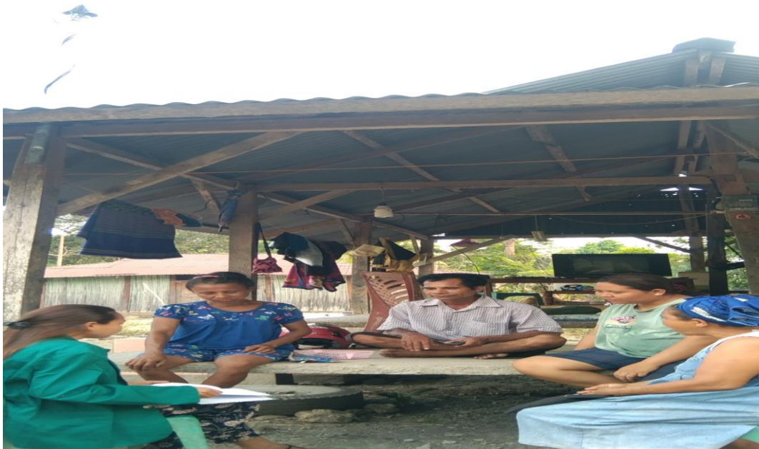
Hasil Dokumentasi Bersama Masyarakat Desa Umalawain