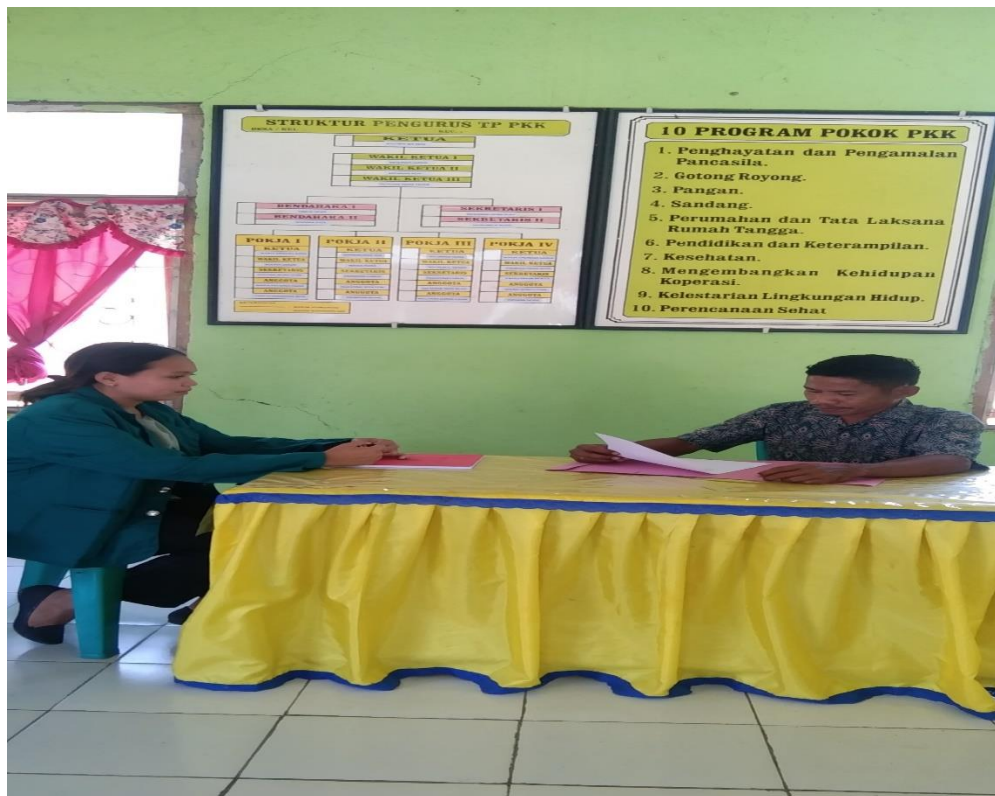
Hasil Dokumentasi Bersama Bapa Sekretaris Desa Umalawain