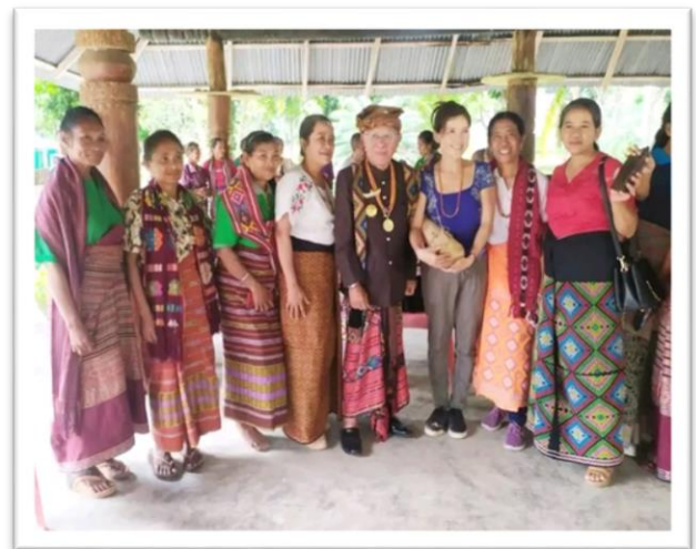
Foto 5. Mempromosikan kain tenun Buna oleh para anggota kelompok Tenun LaTerre.

Dokumentasi terkait pameran yang diikuti oleh kelompok.