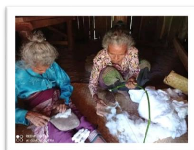
Foto 3. Para anggota kelompok mengajarkan kepada anak cucu cara membuat benang dari kapas dan cara menenun.