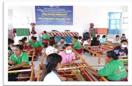
Foto 4. Kepercayaan yang diberikan kepada para anggota kelompok dalam menjalankan tugas yaitu menenun.

Dokumentasi terkait kepercayaan yang diberikan kepada anggota kelompok.