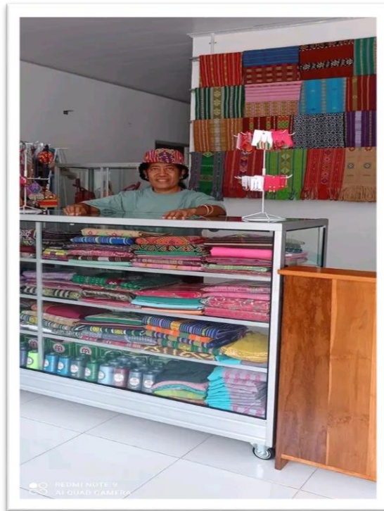
Foto 15. Depan rumah kelompok tenun dan di dalam rumah kelompok tenun LaTerre.