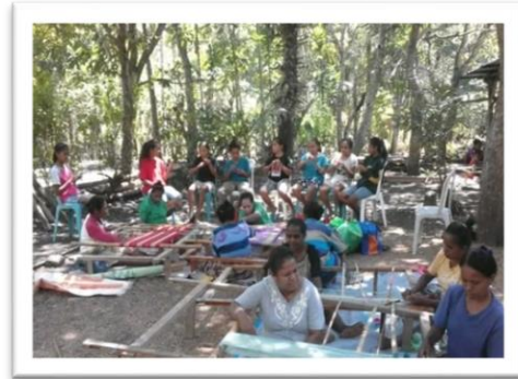
Foto 1. Interaksi para anggota dalam menenun di kelompok Tenun LaTerre.