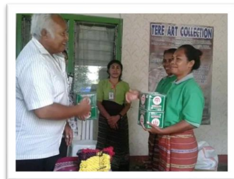
Foto 2. Kerjasama dengan pemerintah dengan membuat adat dan mendapatkan bantuan berupa bahan.