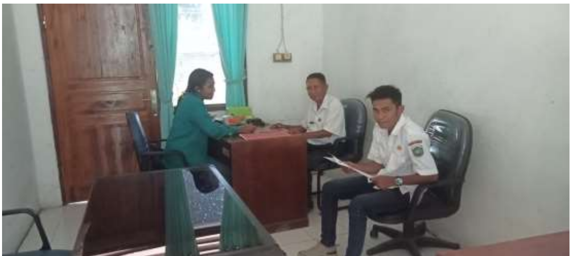
Berdasarkan gambar diatas peneliti melakukan wawancara dengan beberapa pegawai di Kantor Badan Pengelolaan Perbatasan Daerah Kabupaten Malaka