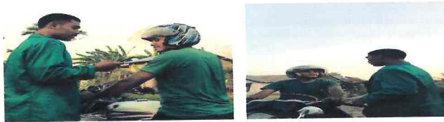
Wawancara Dengan Masyarakat/Pengendara Kabupaten Malaka