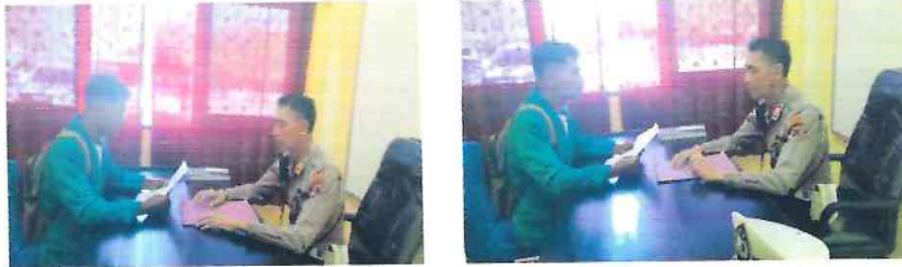
Wawancara Dengan Kasat Lantas Polres Malaka