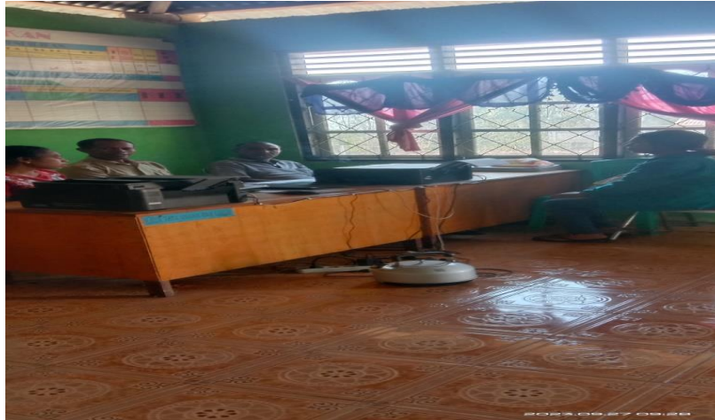
Wawancara Dengan Bapak Kepala Desa Batnes, Bapak Kaur Perencanaan dan Tokoh Masyarakat Desa Batnes