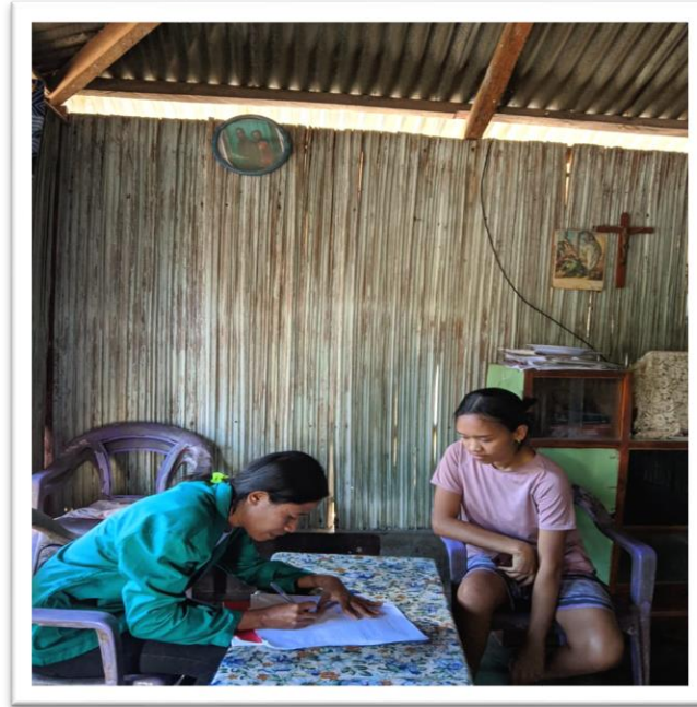
Sumber Data: Dokumentasi Peneliti, 2023