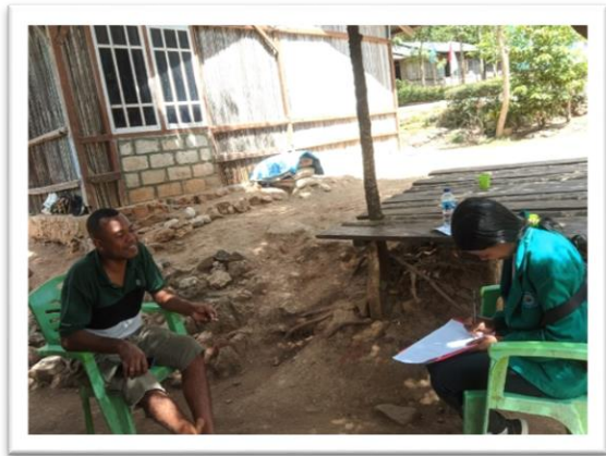
Sumber Data: Dokumentasi Peneliti, 2023