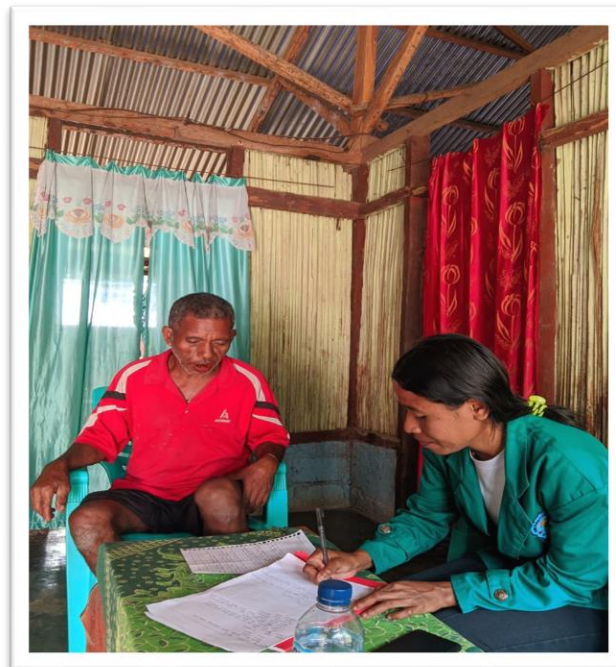
Sumber Data: Dokumentasi Peneliti, 2023