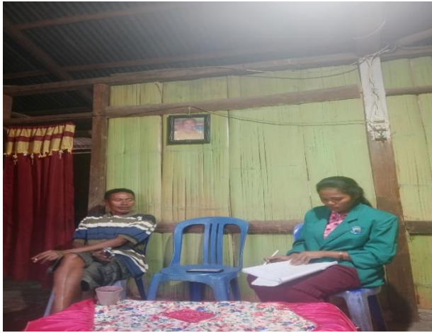
Wawancara Bersama Ketua Kelompok Tani Pelita Jaya