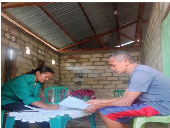
Wawancara bersama Ketua kelompok Tani Oelatfob