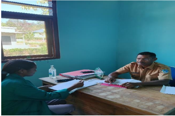
Wawancara bersama Kepala Desa Noepesu