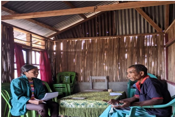
Wawancara bersama Ketua Kelompok tani Pelita Karya