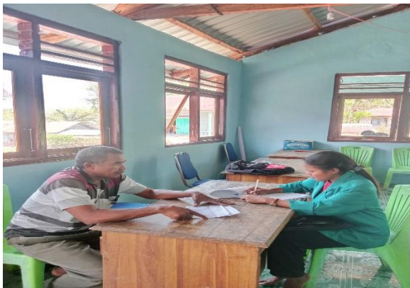
Wawancara bersama Bapak Kasie Kesra