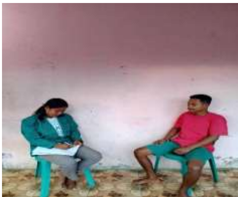
Gambar 3 Wawancara bersama dusun 1,2