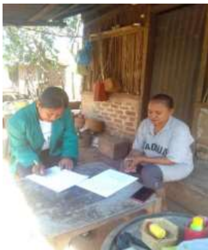
Gambar 5 Wawancara Bersama Masyarakat