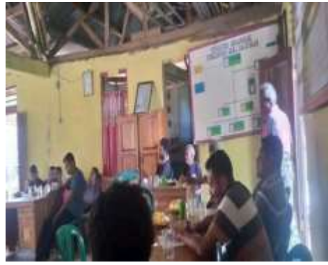
Gambar 7 Diskusi Bersama aparat desa