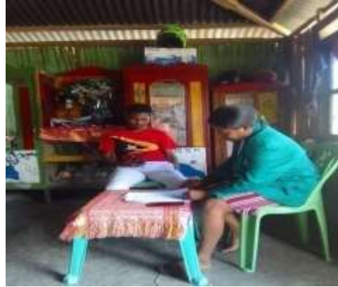
Gambar 2 Wawancara Bersama BPD