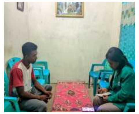
Gambar 4 Wawancara bersama dusun 3,4