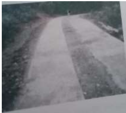
Gambar 9 Pembuatan jalan rabat sesudah