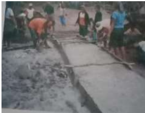
Gambar 8 Pembuatan jalan rabat sebelum