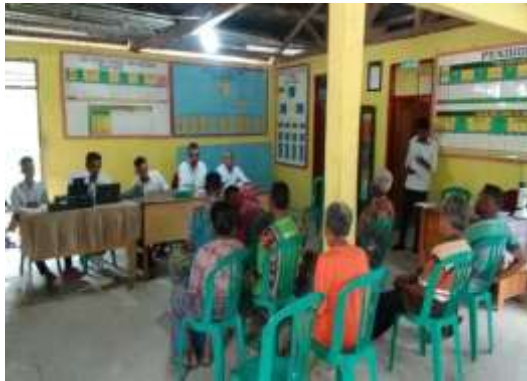
Gambar 6 Rapat Bersama aparat desa dan masyarakat