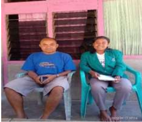
Gambar 1 Wawancara Bersama Kepala desa