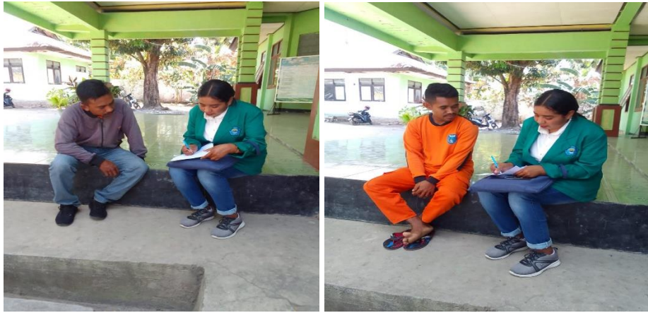
Dokumentasi Bersama Pegawai (Petugas Lapangan Dinas Lingkungan Hidup) Kabupaten TTU