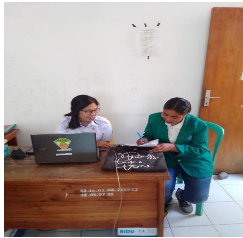
Dokumentasi Bersama Pegawai Dinas Lingkungan Hidup Kabupaten TTU