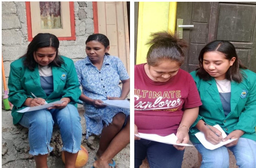
Dokumentasi Bersama Masyarakat