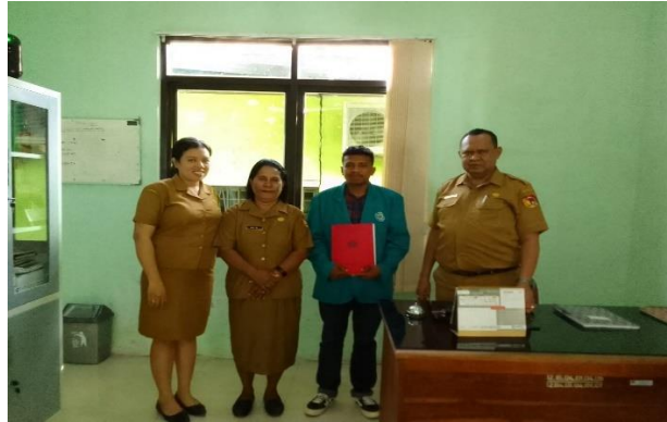
Gambar Lokasi Penelitian Dinas Lingkungan Hidup1 Foto Bersama