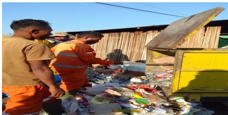
PTT Bagian kebersihan Bekerja Setiap Hari Kerja dari Pukul 06:00 sampai selesai