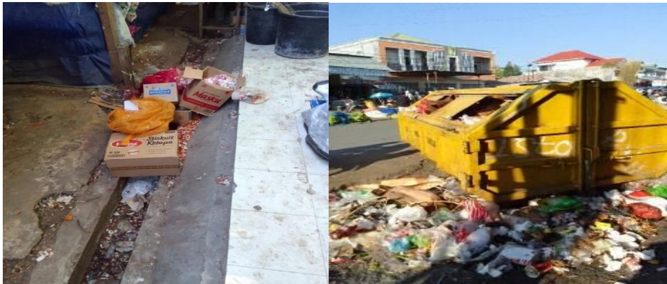
Kondisi sampah bagian dalam pasar Tempat Pembuangan Sampah Sementara