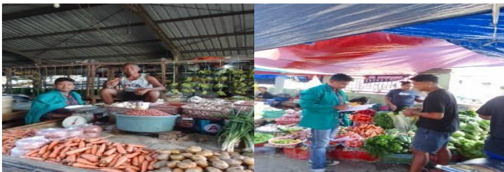
Gambar Wawancara Kepada Pedagang Yang Ada Di Pasar