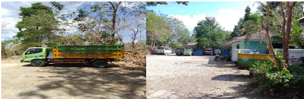
Gambar Sarana Prasarana Dinas Lingkungan Hidup1 Foto Mobil Dan Foto Area Sekitar DLH