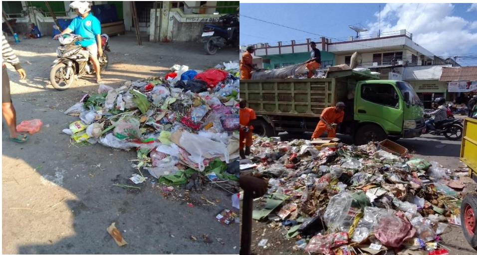
Gambar Penumpukan Sampah Di Pinggir Jalan Pasar Baru