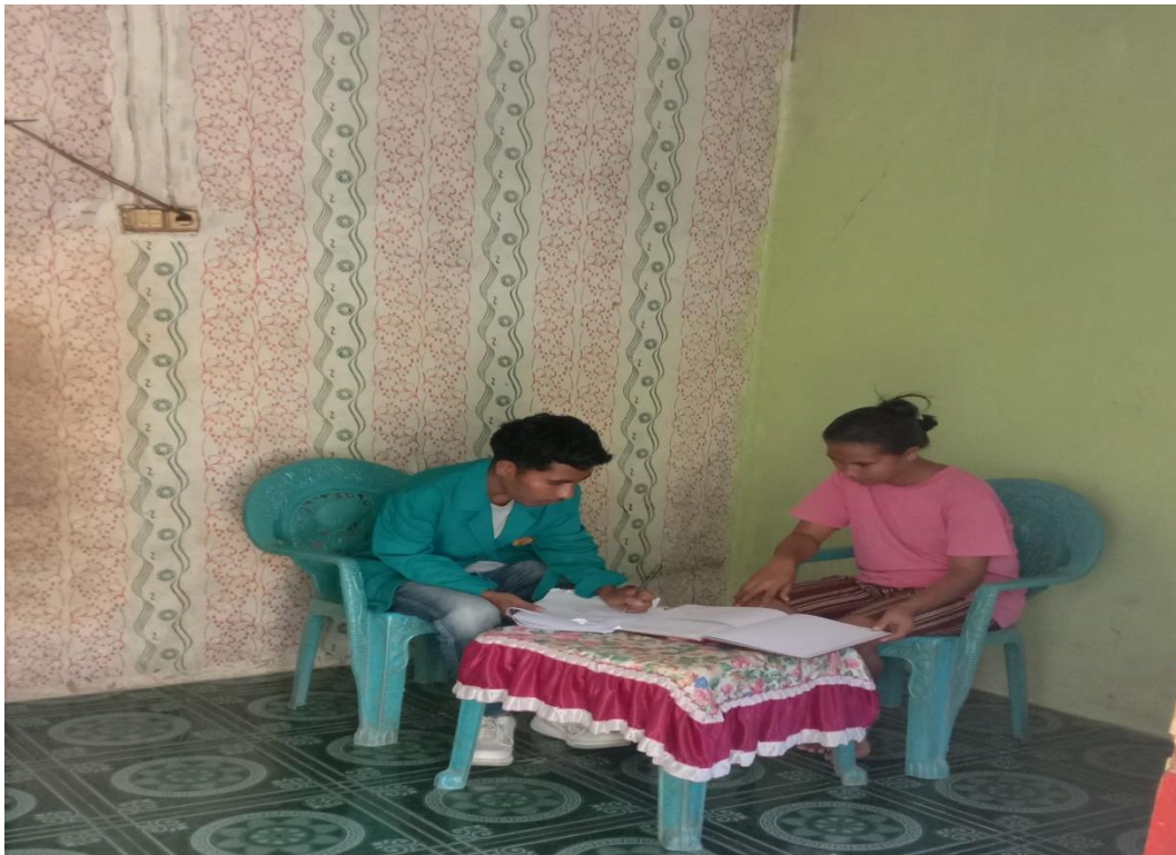
Wawancara bersama Tokoh masyarakat