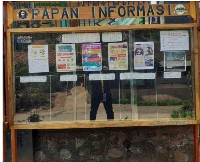
Papan informasi Desa Numponi