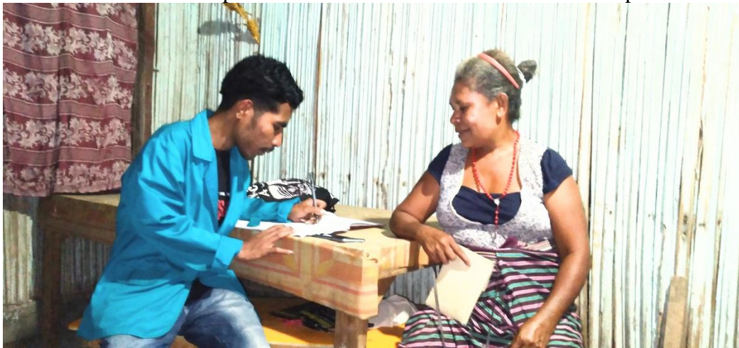
Wawancara bersama tokoh masyarakat Desa Numponi