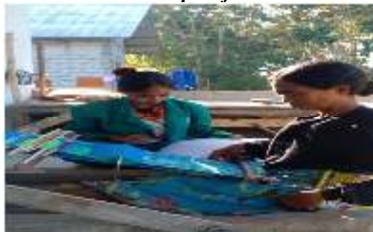
Gambar 5.3 wawancara ibu perajin tenun ikat kelompok 2