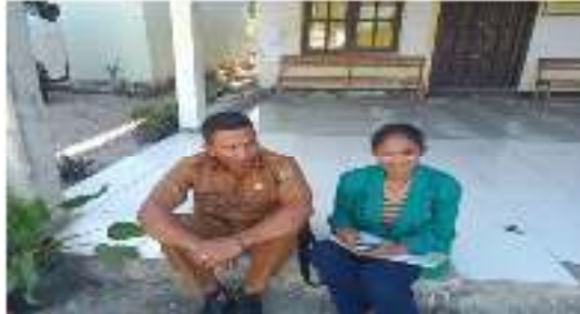
Gambar 5.1 wawancara bersama bapak kepala desa