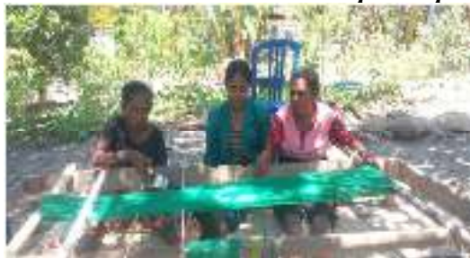
Gambar 5.2 wawancara ibu perajin tenun ikat kelompok 1