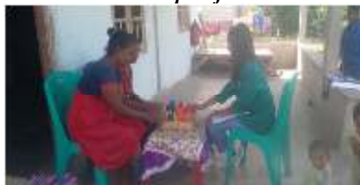
Gambar 5.4 wawancara ibu perajin tenun ikat kelompok 3