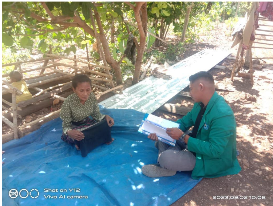
Wawancara dengan masyarakat penerima PKH