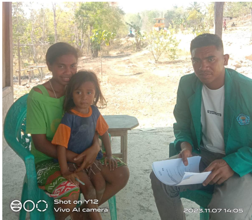
Wawancara dengan masyarakat Bukan Penerima PKH