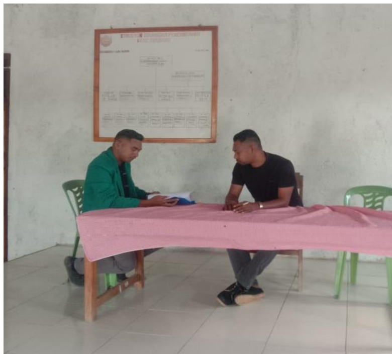
(Wawancara dengan Kepala Desa Tniumanu)