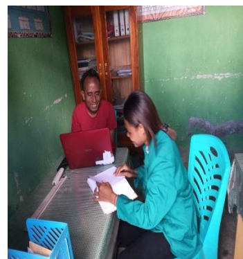
Wawancara Bersama Aparat Desa Hauteas Induk Tahun 2023