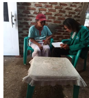
Wawancara Bersama Masyarakat Desa Hauteas Induk Tahun 2023