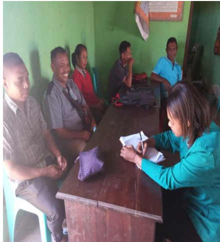
Wawancara bersama Kepala Desa dan BPD Tahun 2023