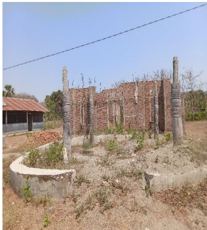
Gambar Kantor Desa Hauteas Induk Tahun 2019 -2023