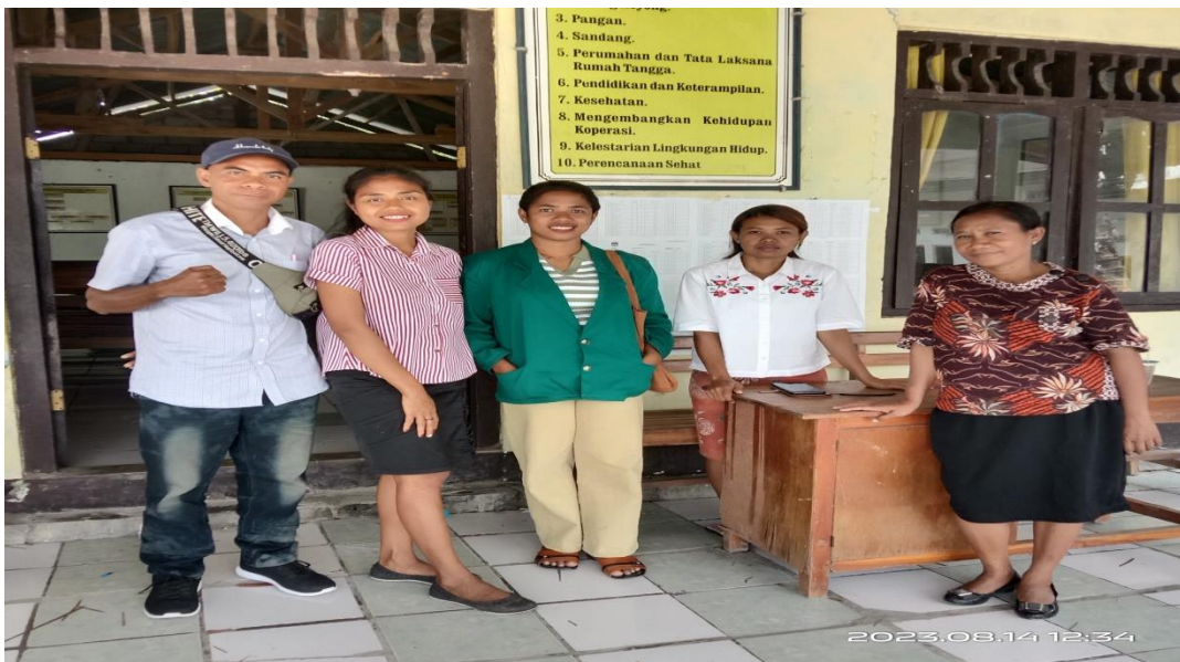
Gambar 5.4 wawancara bersama Tim Penyusun RKPDes.