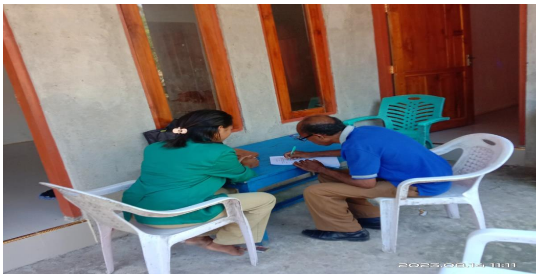
Gambar 5.2 wawancara bersama bapak ketua BPD (badan permusyaratan desa)