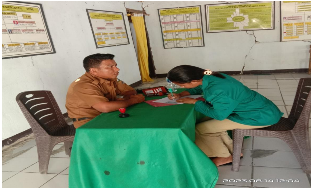
Gambar 5.1 wawancara bersama bapak kepala desa laleten