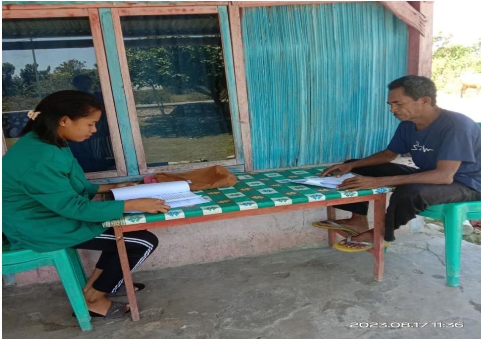
Gambar 5.3 wawancara bersama toko masyarakat.