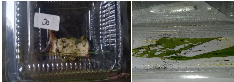
Gambar : Hasil dari pemberian ekstrak daun pepaya pada ulat krup