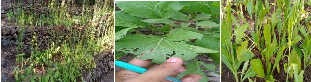
Gambar: Tanaman sawi