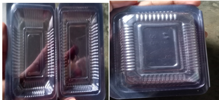
Gambar : Plastik mika sebagai tempat penyimpanan ulat