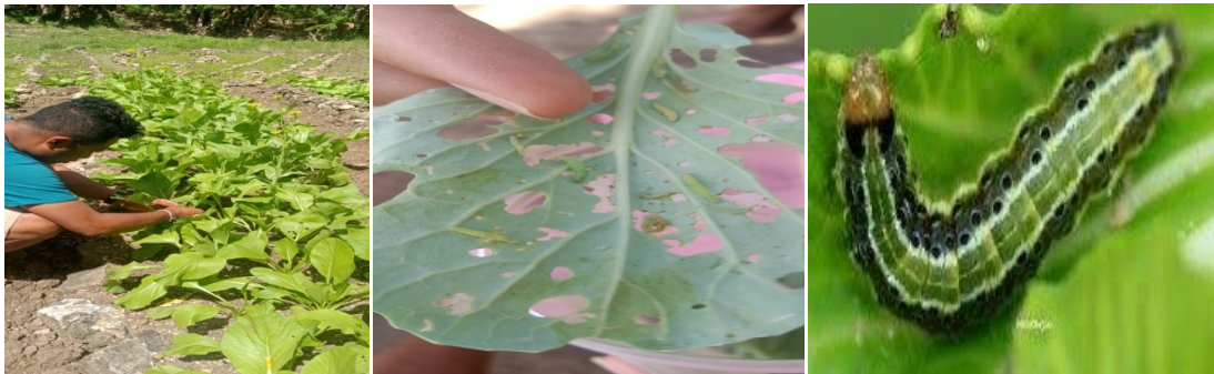
Gambar: Proses pengambilan ulat pada tanaman sawi