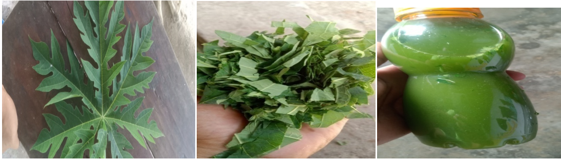
Gambar :Pembuatan ekstrak daun pepaya