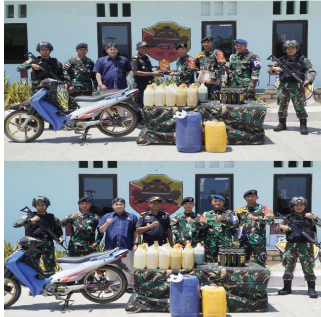
Penyerahan Barang Bukti Hasil Penggagalan Penyelundupan oleh Satgas Pamtas RI-RDTL Sektor Barat Yonkav 10