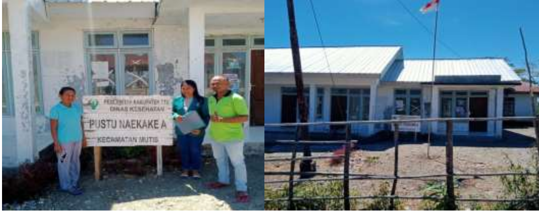
(Profil Puskesmas Pembantu (PUSTU) Naekake A)