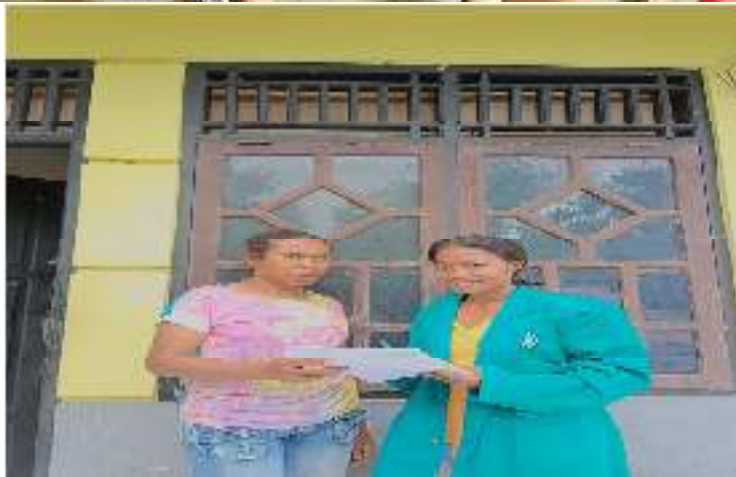
Sumber data : Dokumentasi penelitian 2023