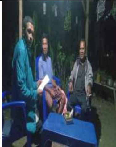
Wawancara dengan Ketua BPD dan Anggota BUMDes Usapinot