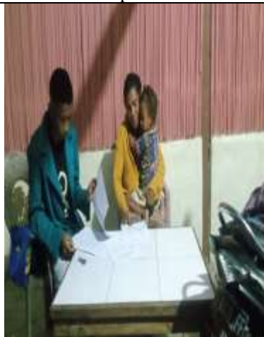
Wawancara dengan Masyarakat Usapinonot