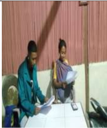
Wawancara dengan Anggota BUMDes Usapinonot