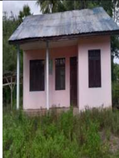
Gedung BUMDes Usapinot