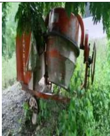
Mesin Moleng BUMDes Usapinot