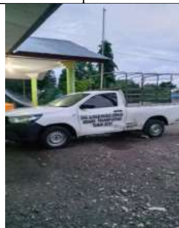
Mobil Operasional BUMDes Usapinot