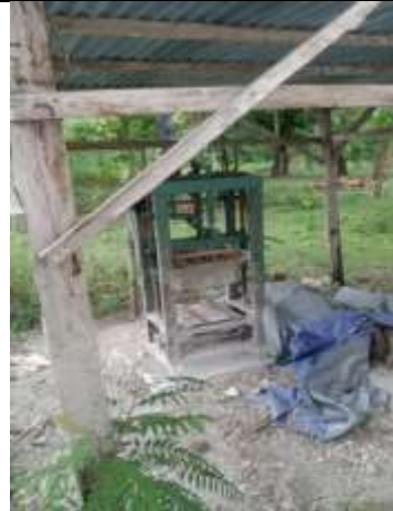
Mesin Cetak Batako BUMDes Usapinot