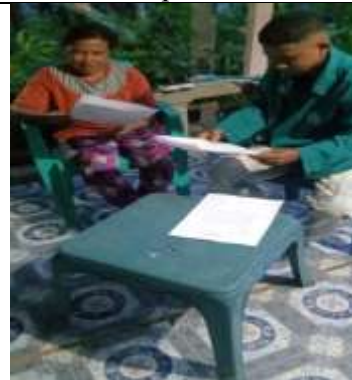
Wawancara dengan Pengurus BUMDes Usapinonot