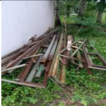
Tenda Jadi BUMDes Usapinot