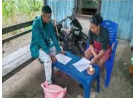
Wawancara dengan Anggota BUMDes Usapinonot