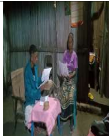
Wawancara dengan Masyarakat Usapinonot