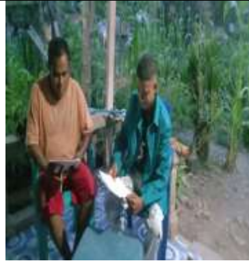
Wawancara dengan Ketua BUMDes Usapinonot