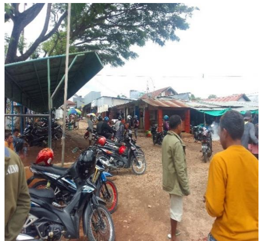
Gambar Keadaan Parkiran