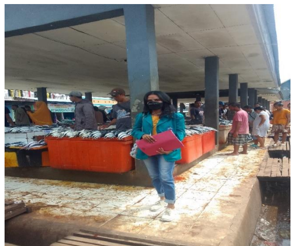
Foto Di Bagian Penjual Ikan