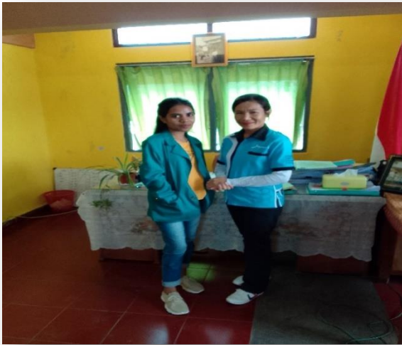
Foto Bersama Ibu Ketua UPTD