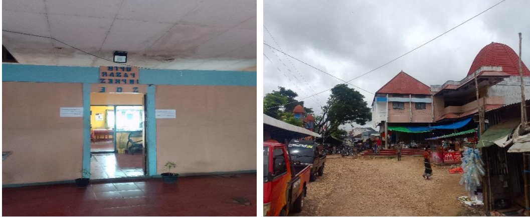
Gambar Kantor UPTD Pasar Inpres Soe