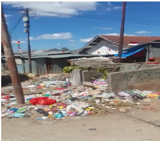
Gambar Keadaan Sampah