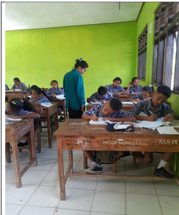
Gambar 3 Peneliti Mengawasi Siswa Dalam Menulis