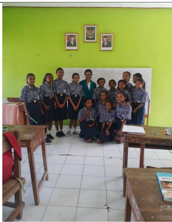
Gambar 6 Foto Bersama