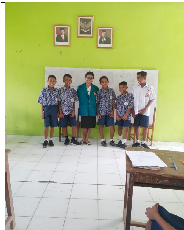
Gambar 5 Foto Bersama