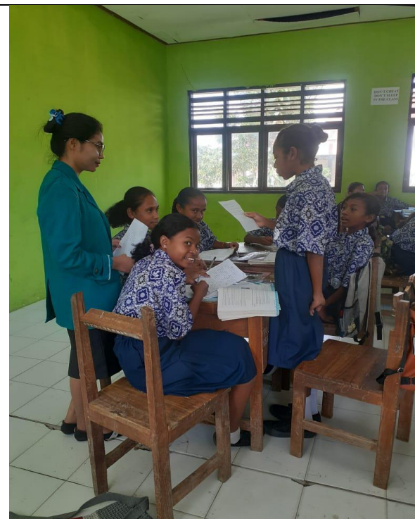
Gambar 4 Siswa Mempresentasikan Hasil Diskusi