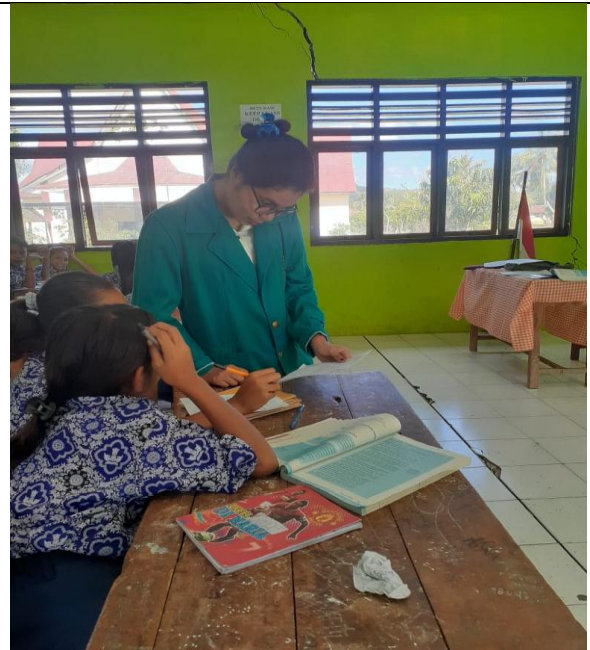
Gambar 2 Peneliti Menjawab Pertanyaan Dari Siswa