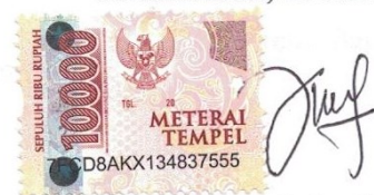
Bernadetha Obe NPM: 42180081