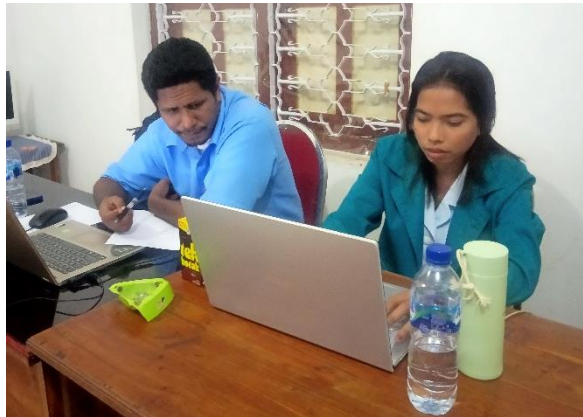
Demo Program untuk hak akses Operator Sekolah