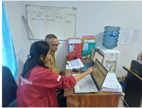
Demo Program untuk hak akses Admin BP4D