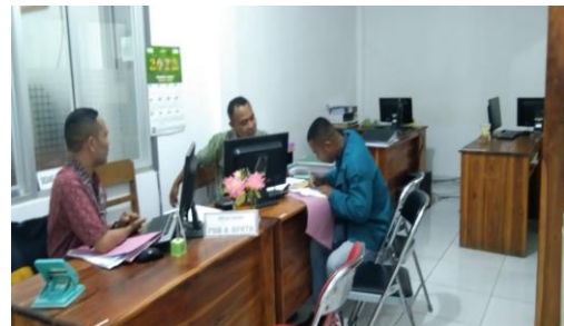
Wawancara Dengan Pegawai PBB