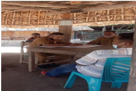
Pendataan ulang objek pajak baru.