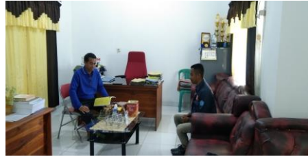
Wawancara dengan kepala Bapenda TTU