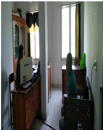
Pengambilan Data Terkait Skripsi