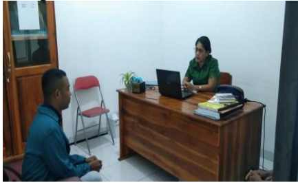
Wawancara dengan KABID PBB.