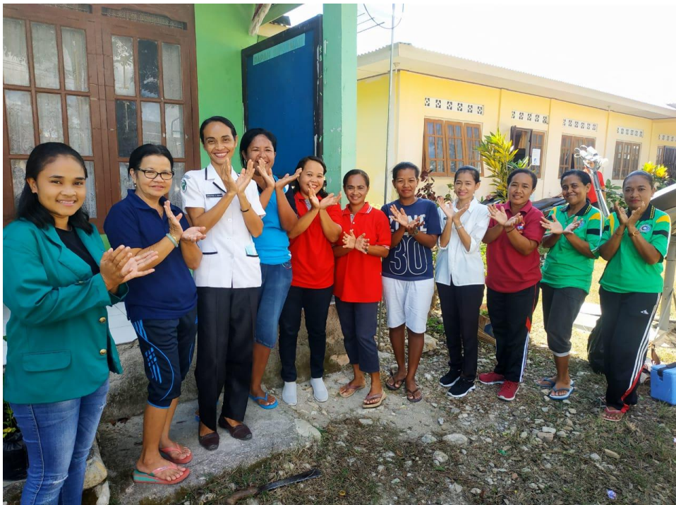
Foto Bersama Ketua dan Anggota PKK Desa Naitimu