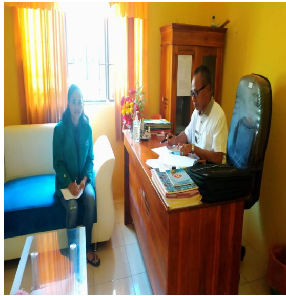
Wawancara Dengan Kepala Desa Naitimu