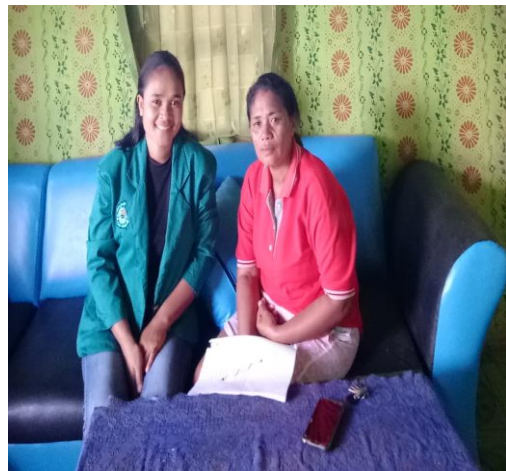
Wawancara Anggota Pkk