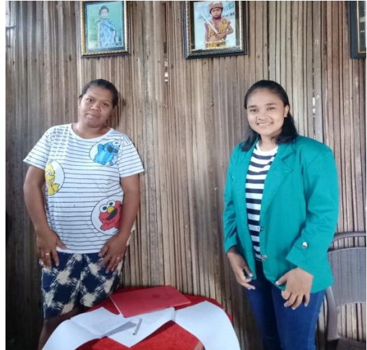
Wawancara Dengan Masyarakat Naitimu