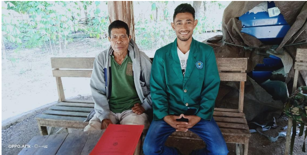
Wawancara bersama Ketua Kelompok Lanaus Jaya.