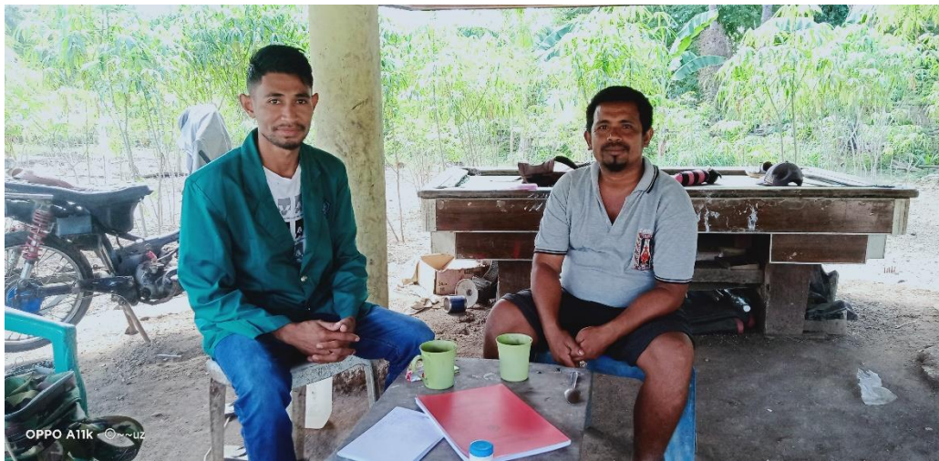
Wawancara bersama Ketua Kelompok Tani Bua Mese