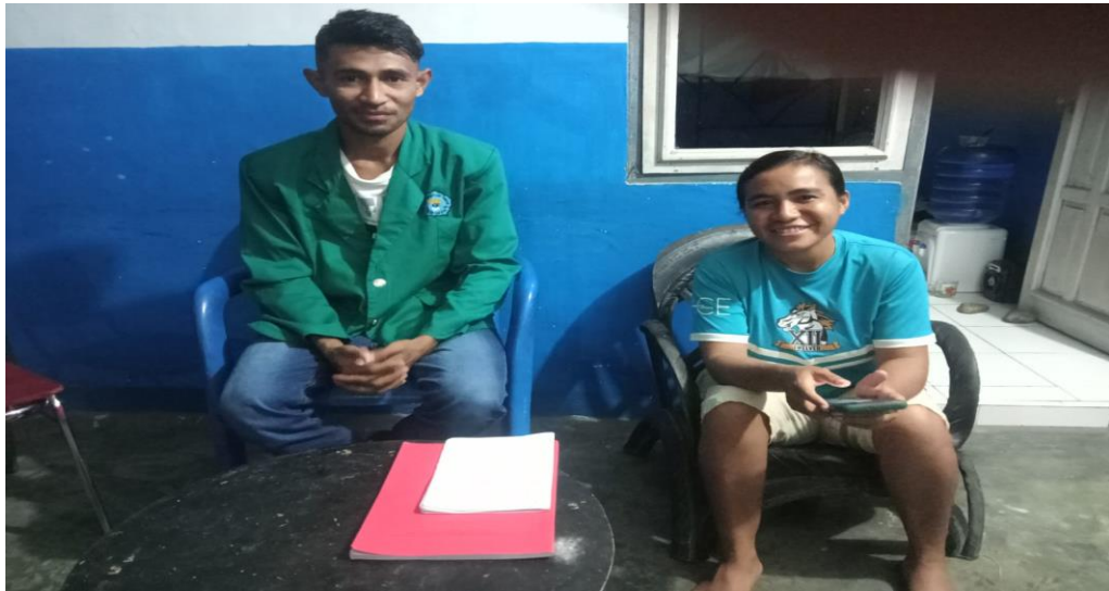
Wawancara bersama pendamping pelaksana Program Tanam Jagung Panen Sapi Desa Lanaus tahun 2019.