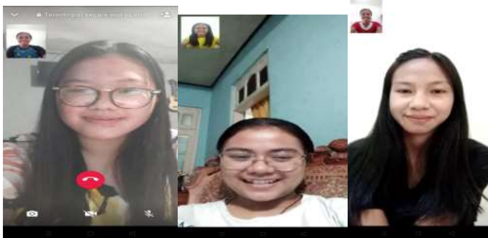
Gambar Ketika Wawancara Via Whatsapp