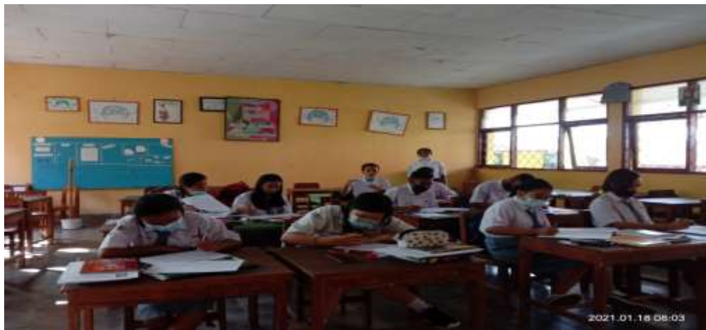
Gambar Ketika Tes Tertulis Berlangsung