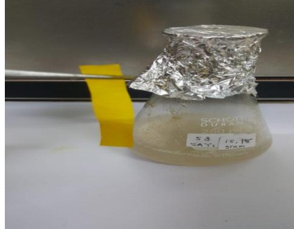
Gambar hasil uji negatif boraks