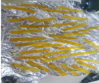
Gambar uji kertas formalin dan boraks