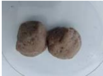
Gambar sampel bakso