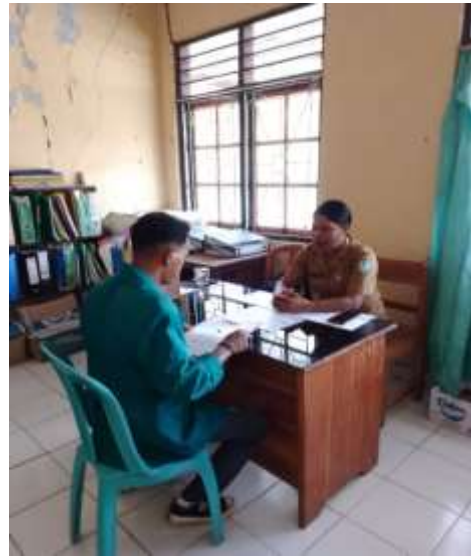
Wawancara bersama Ibu Seksi Pem. Trantib