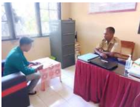
Wawancara Bersama Bapak Sekretaris Lurah