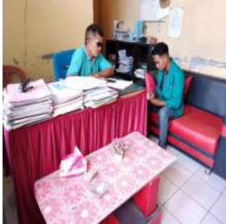
Wawancara bersama Bapak Lurah