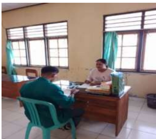
Wawancara bersama Ibu Seksi Ekbang