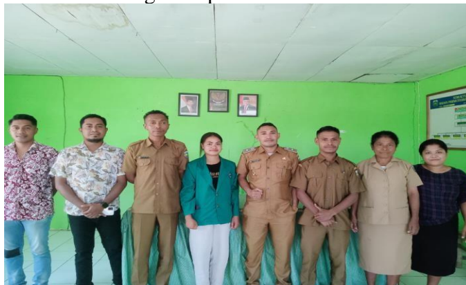
Gambar 1.2 wawancara dengan Aparat Desa Manulea