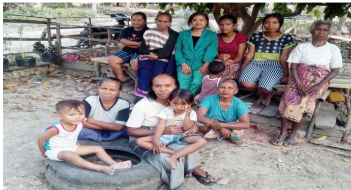
Gambar 1.3 wawancara dengan Masyarakat Desa Manulea