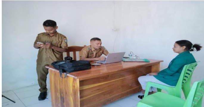
Gambar 1.1 Wawancara dengan Kepala Desa Manulea