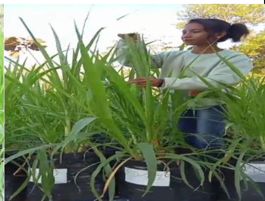
Pengukuran Jumlah Daun