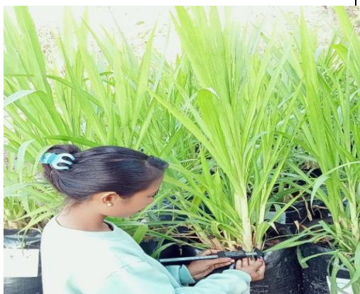
Pengukuran Diameter Batang