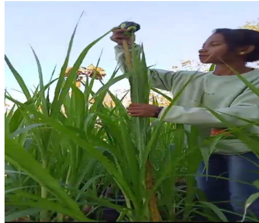
Pengukuran Tinggi Tanaman