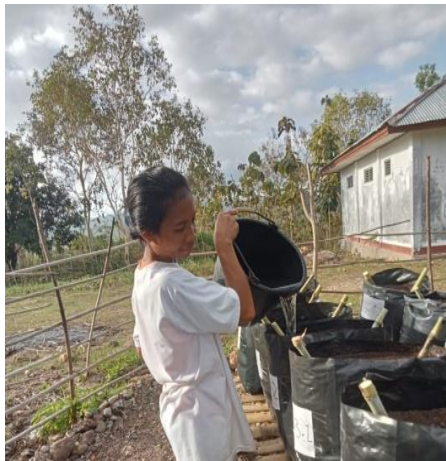
Penyiraman Pada Stek Rumput Raja