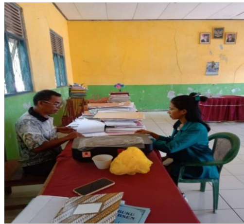
Gambar 4 wawancara bersama komite sekolah SDK Obokin