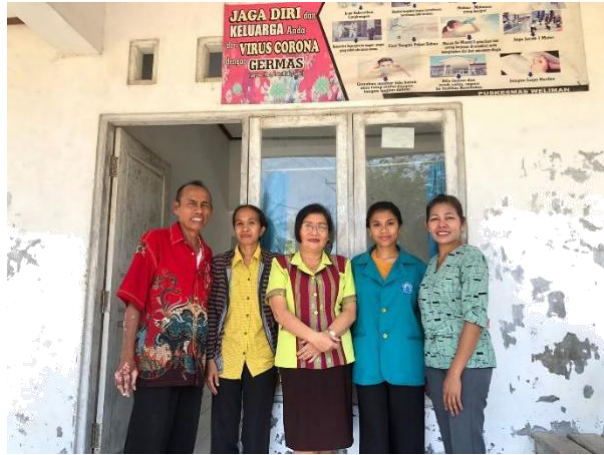
Hasil Dokumentasi Ibu Bidan Desa Wederok Bersama Kader