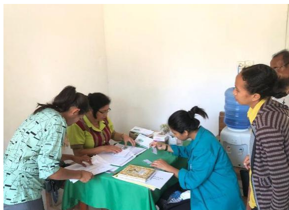
Hasil Dokumentasi Kartu Indonesia Sehat (KIS)