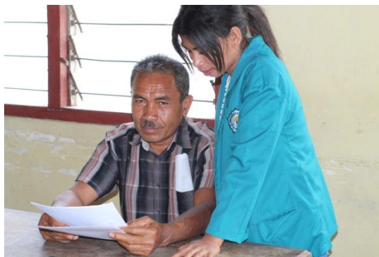
Gambar 2.5 Wawancara dengan Pemerintah Desa