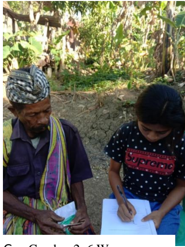
Gambar 2. 6 Wawancara dengan Tokoh Adat