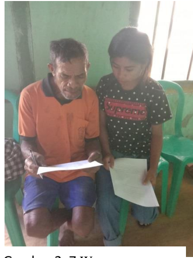
Gambar 2. 7 Wawancara dengan Tokoh Adat