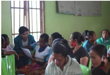
Gambar 2.15 Wawancara dengan Masyarakat