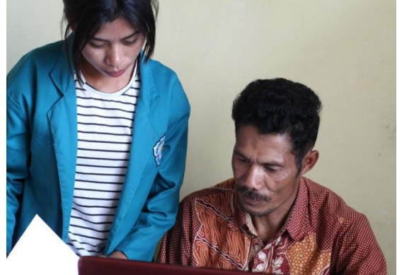
Gambar 2.2 Wawancara dengan Pemerintah Desa