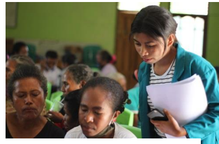
Gambar 2.14 Wawancara dengan Masyarakat