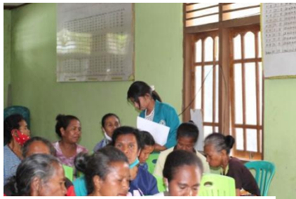
Gambar 2.13 Wawancara dengan Masyarakat