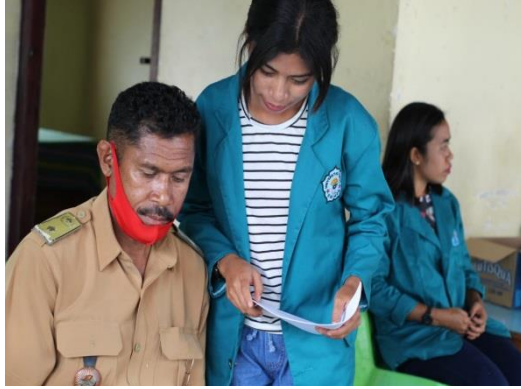
Gambar 2.1 Wawancara dengan Pemerintah Desa