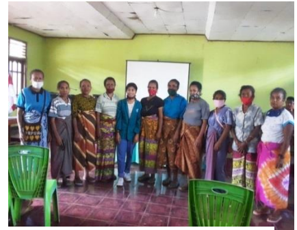
Gambar 2.12 Wawancara dengan Masyarakat