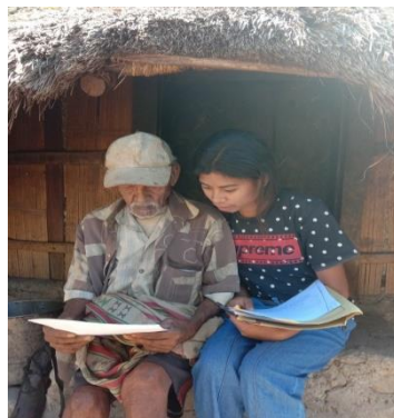
Gambar 2.10 Wawancara dengan Tokoh Adat