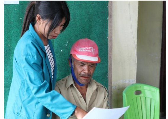
Gambar 2.4 Wawancara dengan Pemerintah Desa