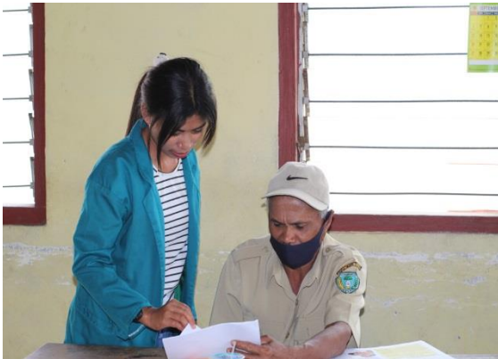
Gambar 2.3 Wawancara dengan Pemerintah Desa