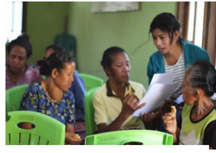
Gambar 2.16 Wawancara dengan Masyarakat