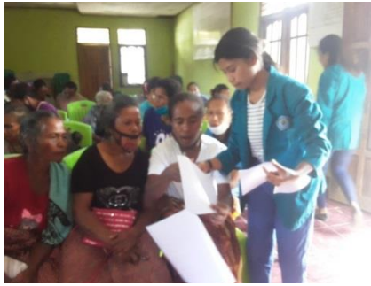
Gambar 2.11 Wawancara dengan Masyarakat