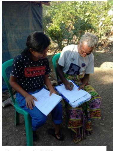
Gambar 2.8 Wawancara dengan Tokoh Adat