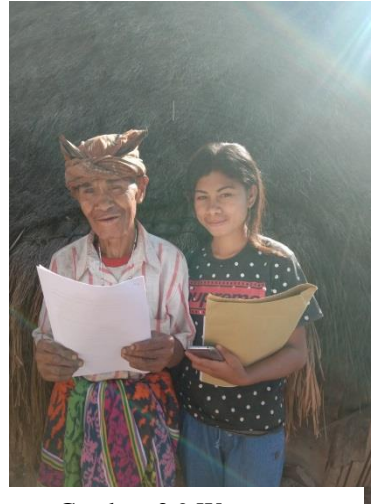
Gambar 2.9 Wawancara dengan Tokoh Adat