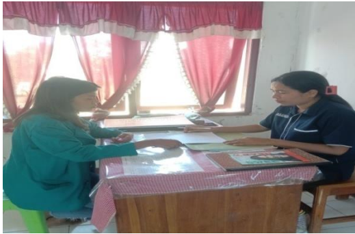
Wawancara bersama bidan Desa Maurisu tengah