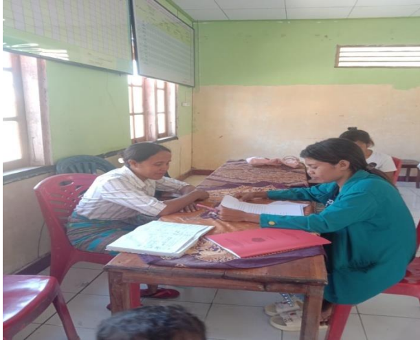
Wawancara bersama Ibu Kepala Desa Maurisu Tengah