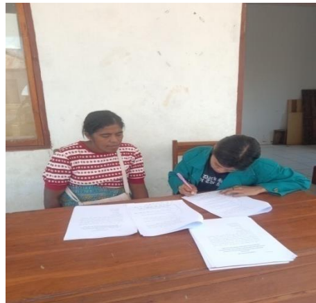
Wawancara bersama kader posyandu