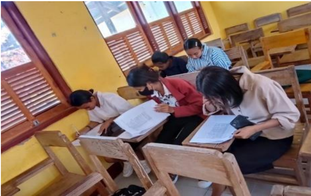
Pengambilan data mahasiswa Program Studi Pendidikan Biologi semester 5