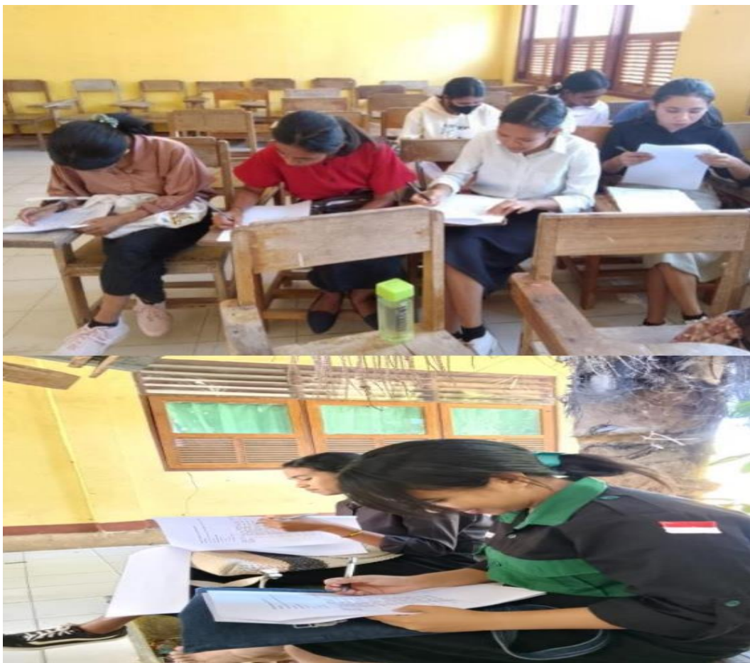
Pengambilan data mahasiswa Program Studi Pendidikan Biologi Semester 9