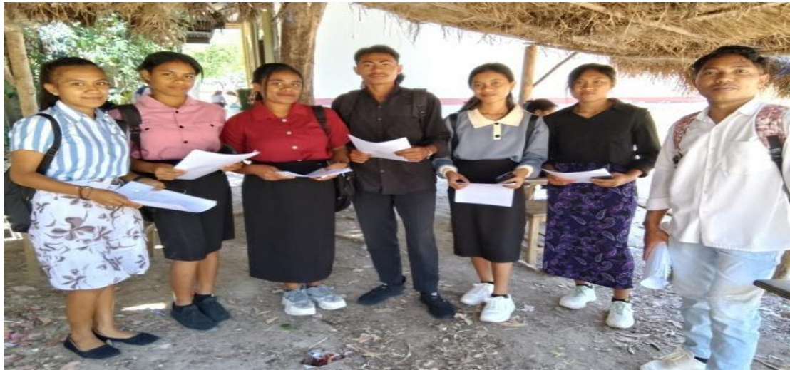
Pengambilan data mahasiswa Program Studi Pendidikan Biologi semester 7