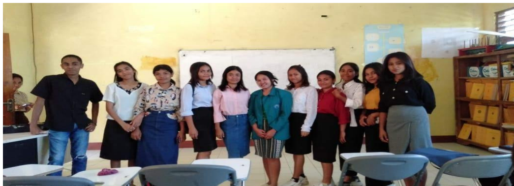
Dokumentasi Bersama Mahasiswa Pendidikan Matematika