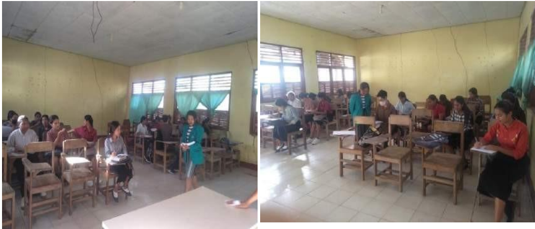
Pengarahan dan pembagian kuisisioner kepada Mahasiswa Pendidikan bahasa Inggris