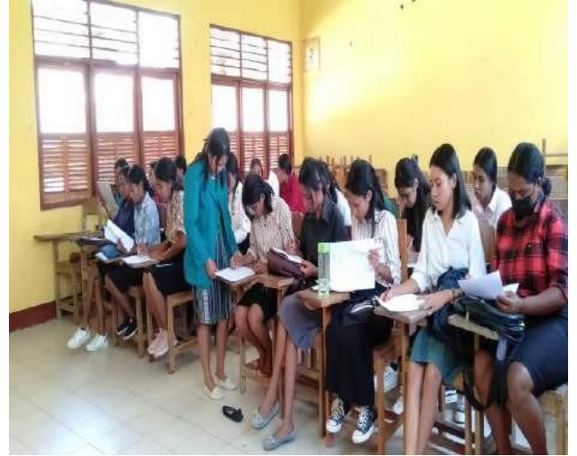
Pengarahan dan pembagian kuisisioner kepada Mahasiswa pendidikan biologi