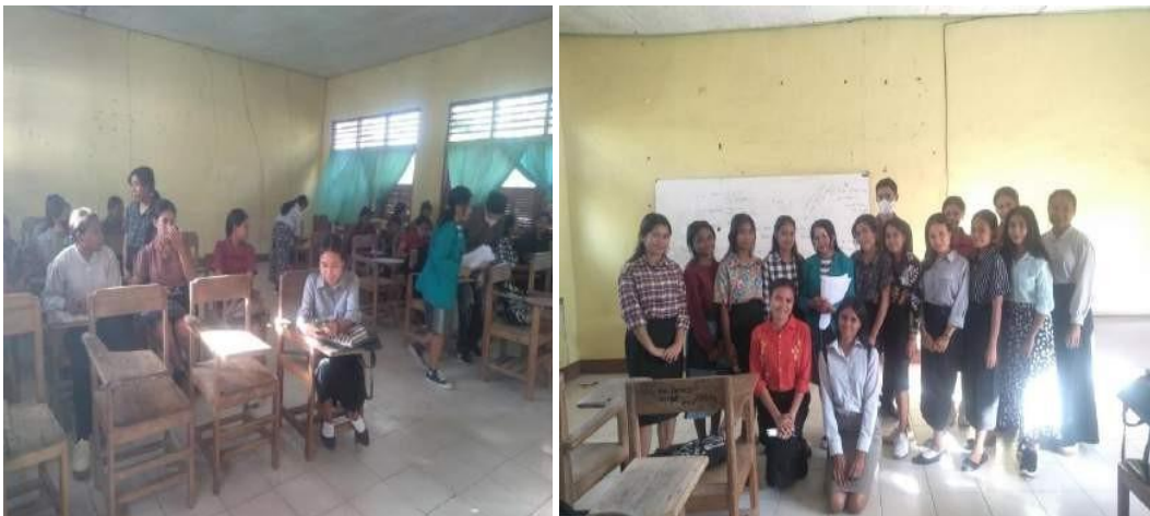
Pengumpulan Hasil Kuisisioner dan Dokumentasi Bersama Mahasiswa Pendidikan bahasa Inggris