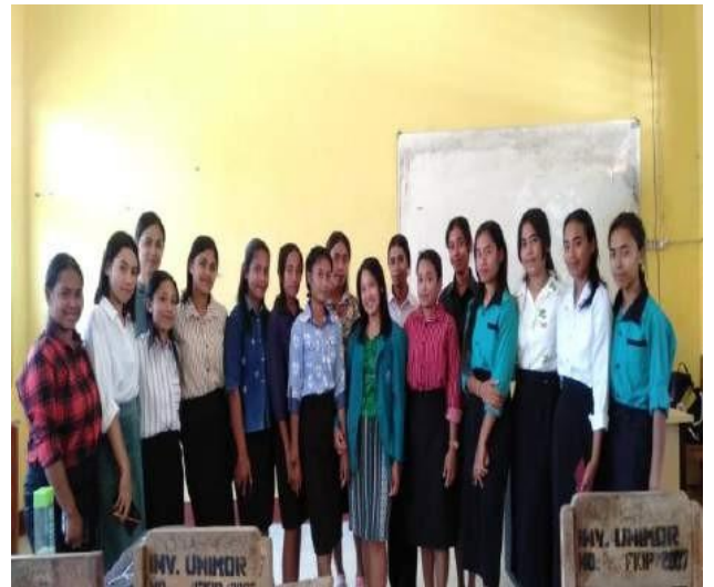
Pengumpulan Hasil Kuisisioner Dan Dokumentasi Bersama Mahasiswa Pendidikan Biologi