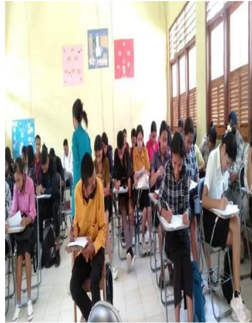
Pengarahannya, pembagian dan pengumpulan Kuisiener Mahasiswa Pendidikan bahasa Indonesia