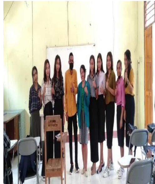
Pengumpulan Hasil Kuisiener Dan Dokumentasi Bersama Mahasiswa Pendidikan bahasa Indonesia