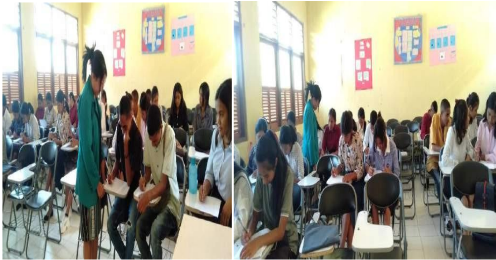
Pengarahan, pembagian dan pengumpulan Kuisisioner Mahasiswa Pendidikan Matematika