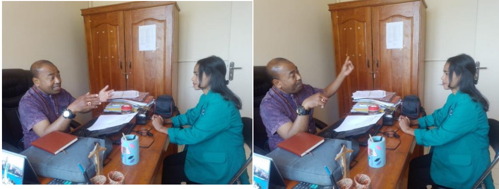
Gambar 1. Wawancara Bersama Kepala Bidang Penelitian Dan Pengembangan Kantor BP4D Kab. Belu