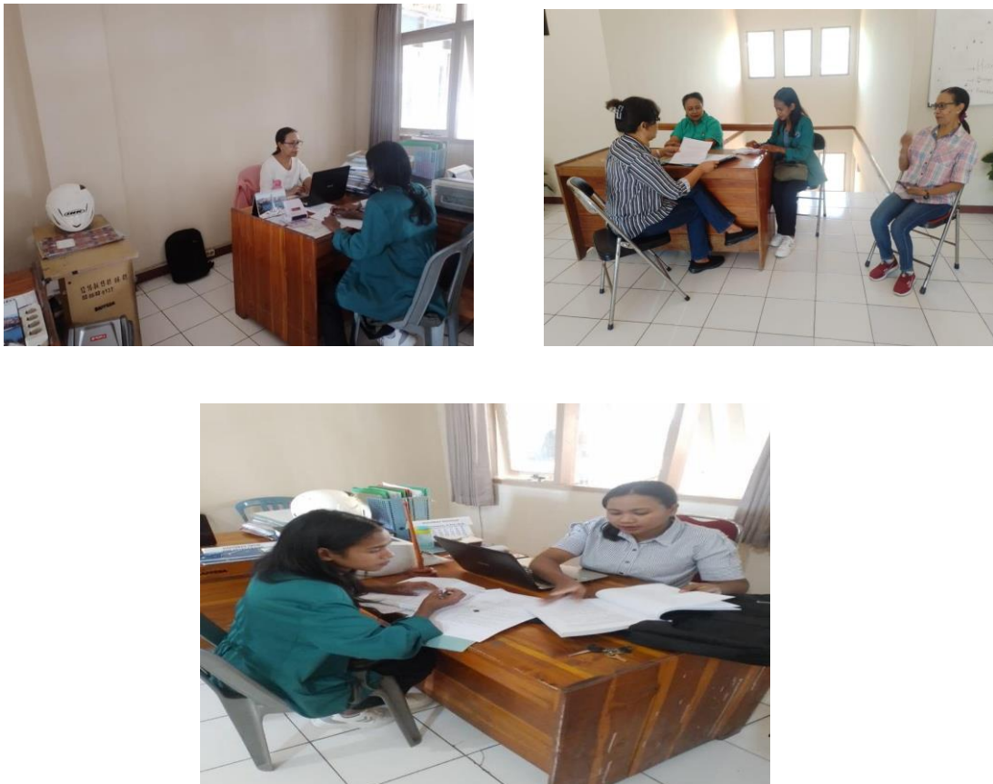
Gambar 2. Wawancara Bersama Pegawai/Staf Pada Kantor BP4D Kab. Belu