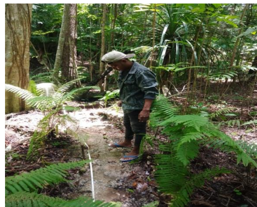
Gambar 4. Pengukuran Arus Debit Air