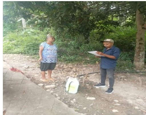
Gambar 3. Kegiatan Wawancara