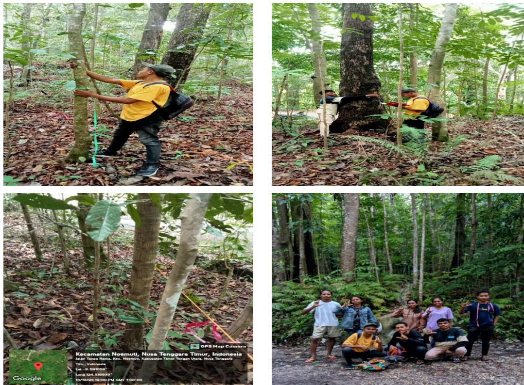
Gambar 2. Pengambilan Data Vegetasi di Sumber Mata Air Bena