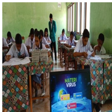
Gambar 2 siswa mengisi soal pre- test