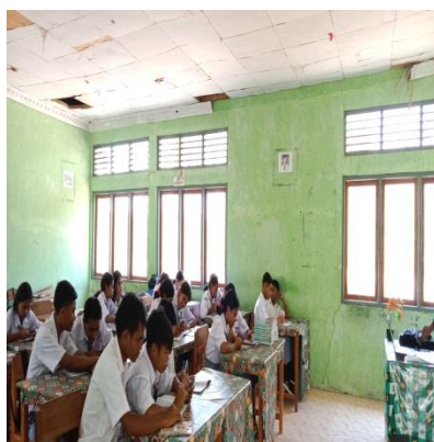
Gambar 9 Siswa mengamati materi di canva