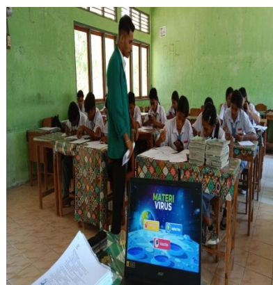
Gambar 4 proses pengisian angket