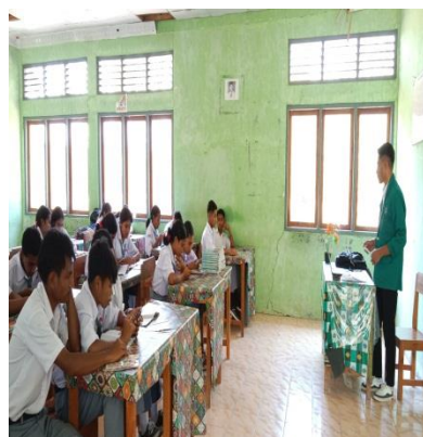
Gambar 10 penjelasan materi