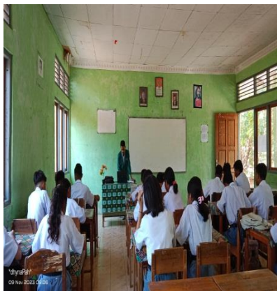
Gambar 7 Penjelasan materi