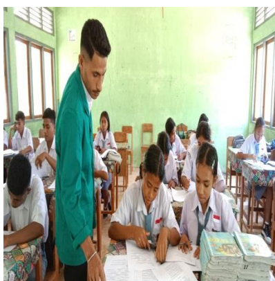
Gambar 5 Proses pengisian post-test