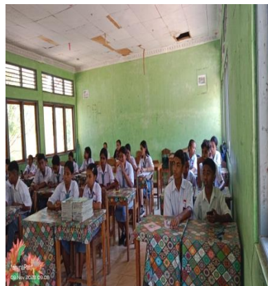
Gambar 8 siswa mendengarkan materi