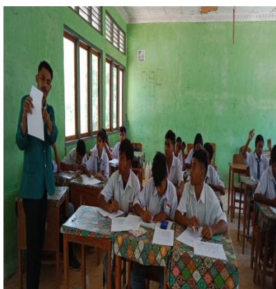
Gambar 3 Proses penjelasan