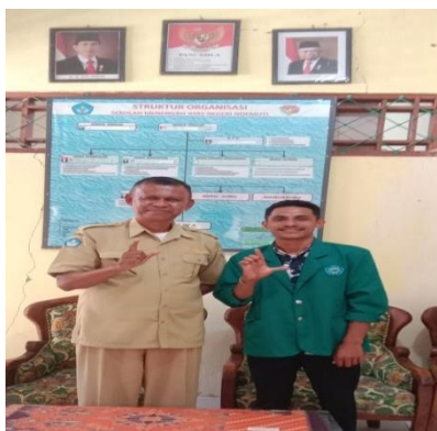
Gambar 1 Foto bersama kelapa sekolah test