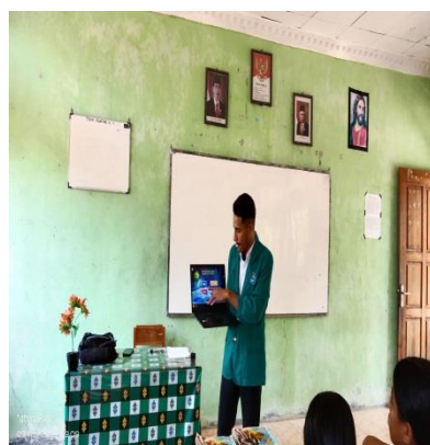
Gambar 6 penjelasan penggunaan canva