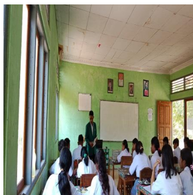
Gambar 11. Pembagian post-test